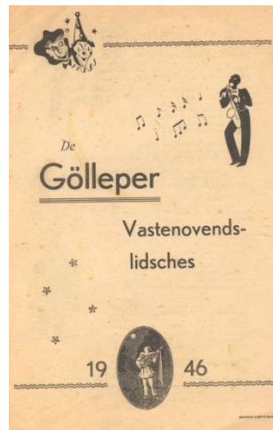
Foto 3, 1946 Gölleper vastenovendslidsjes