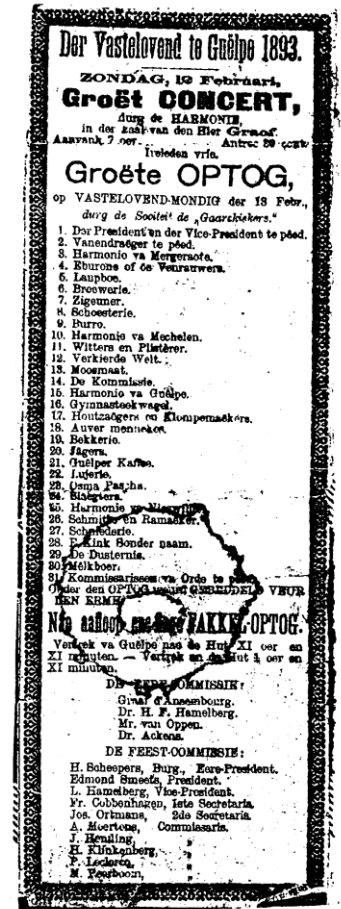
Foto 1 reclame voor de Groëte Optog in 1893