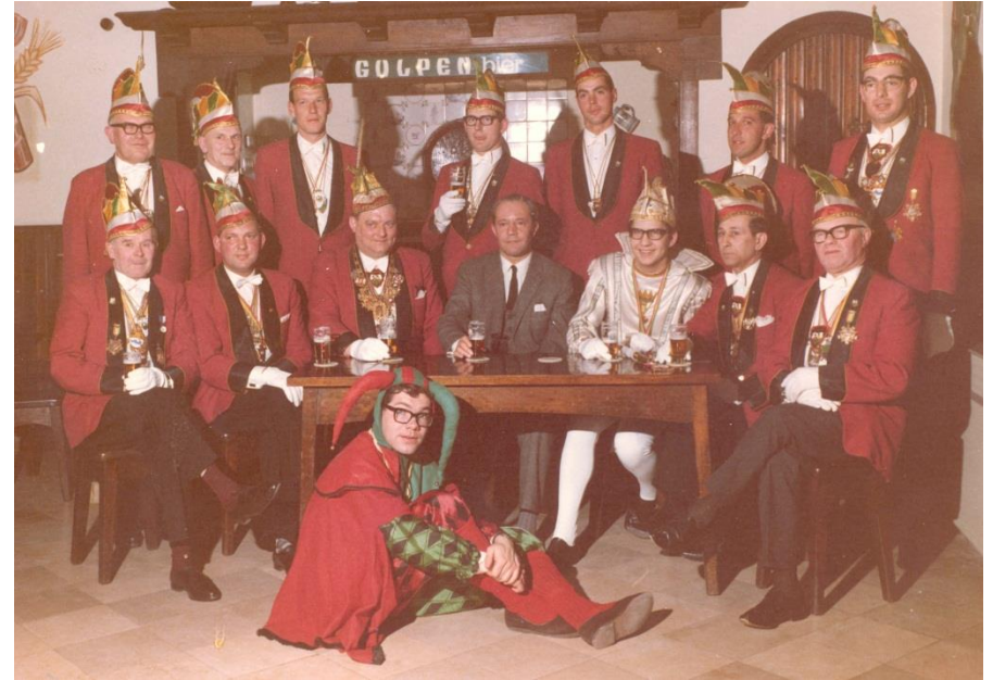
Foto 9 Ontvangst in het Kelderke van de brouwerij in 1967,