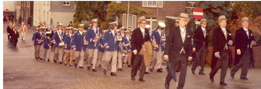
Foto 12, De jubileumoptocht met Harmonie Crescendo